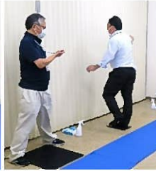
両目閉じ 片足立ちテスト