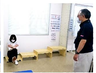
片足立ち上がり テスト