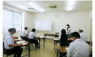
健康づくり講座の様子

協会けんぽ様では、事業所の健康づくり支援の為に年度に一度集団講座を行っており、この度弊社にて無料で提供していただけることになりこの度行われました。