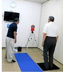
瞬発力テスト (ジャンプ)