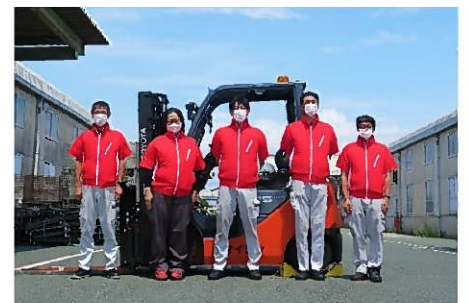
ファン付き作業服を着用した 本社倉庫部の皆さん

猛烈な暑さが連日続いています。熱中症にならないよう、水分補給など意識して作業を行いましょう。