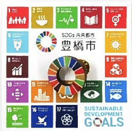
頂いた登録証と 木製ピンバッジ

登録証やSDGs木製ピンバッジには東三河の間伐材が用いられ、ゴール15「陸の豊かさを守ろう」に貢献されています。