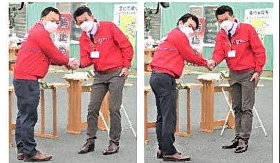
新車のカギを渡している様子

大型に乗務してからまだ日が浅いのに関わらず、新車に乗らせて頂けると聞き、とても驚いています。前回乗っていた車輛と比較して、座席のクッションがとてもやわらかく、長距離運転をしていても腰の負担が軽くなりました。