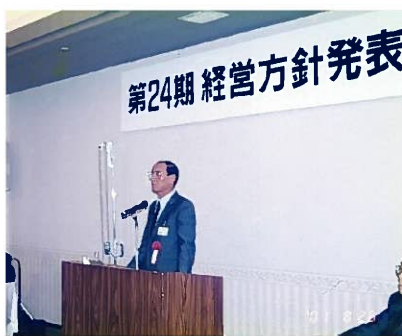
第24期経営方針発表会の様子