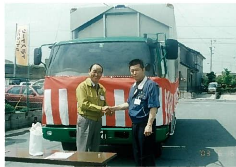
納車式の様子(清水名誉会長と辻社長)