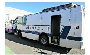
お越し頂いた健診バス

また、健診の結果、再検査となった方を対象に随時面談を実施します。管理部より声を掛けさせて頂いた時は、ご協力頂きますようよろしくお願い致します。面談する時間等のご要望は、管理部または総務部にお申し出頂ければ、随時対応致します。お気軽にお声掛け下さい。なお、再検査となっている項目に関して、現在治療を行っている場合であってもその診断結果が必要となる場合がありますので、お手元で保管をお願いします。皆様にはお手数をお掛け致しますが、ご理解とご協力をお願い致します。