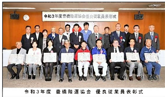
令和3年度 豊橋陸運協会 優良従業員表彰式

豊橋陸運協会による永年勤続優良従業員表彰式が11月17日(水)に豊橋商工会議所にて行われました。20年以上同じ会社に勤務し、勤務成績が優秀な方を会社から推薦することで受賞されます。