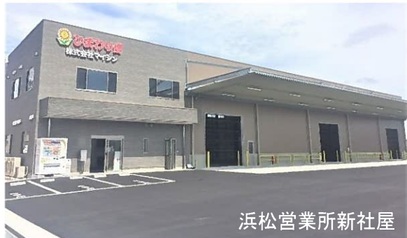
浜松営業所新社屋