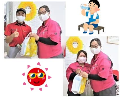
熱中症対策グッズ配布の様子