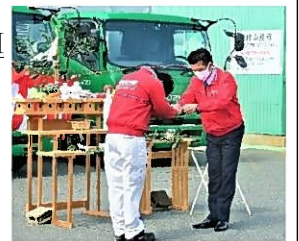
鍵を渡している様子