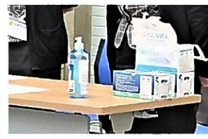
不織布マスク予備の準備