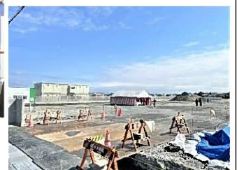
新営業所建設予定地