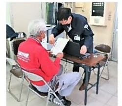
適性検査中の様子