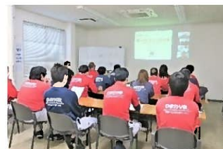
安全講習会の様子