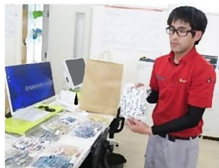
手作り布マスクを選んでいる様子