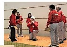
活力朝礼前のパフォーマンス