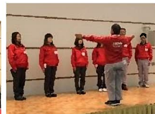
前期各グループ発表の様子