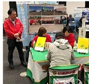
就職相談会の様子