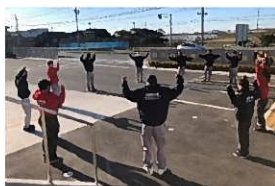
ラジオ体操の様子