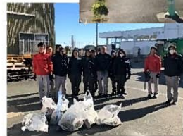
道路のゴミ拾いの様子