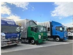
オリジナルステッカー

あおり運転は、重大な交通事故につながる悪質・危険な行為です。運転免許の停止等の行政処分を厳正に行われています。交通事故防止の為に、前の車が急に止まっても、追突しないよう安全な速度と車間距離をとることが必要です。