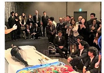
マグロ解体ショー