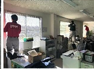
事務所内清掃の様子