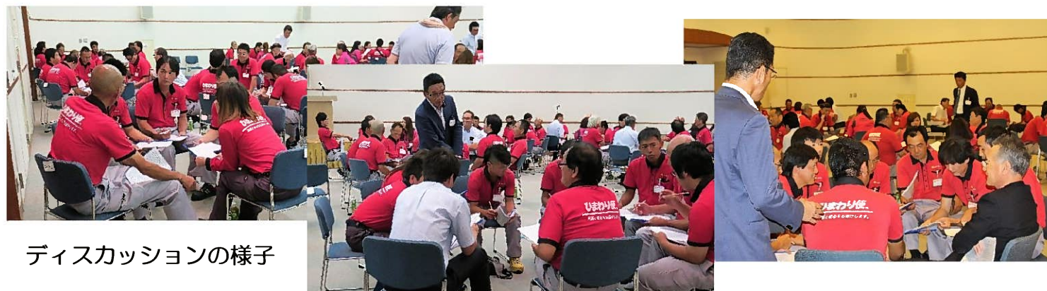
ディスカッションの様子