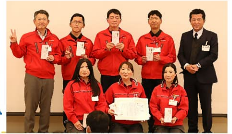
第11回 活力朝礼コンクール