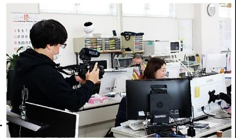
← 配車業務中の様子 →