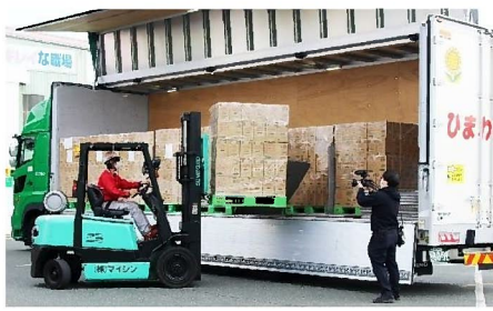
運転(車内撮影)・ リフト作業の様子