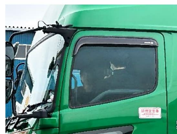
助手席から撮影して頂いています

また、ご意見やご感想、企画提案などがありましたら、総務部までご連絡いただけますと幸いです。