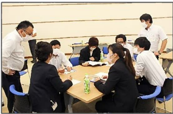
ディスカッションの様子

今回より、各営業所のリーダー・サブリーダー計42名からA~Gの6名ずつ7グループに分かれて、リーダー会方針についてディスカッションが行われました。各グループ発表後、多数決により下記3つに絞られ決定されました。