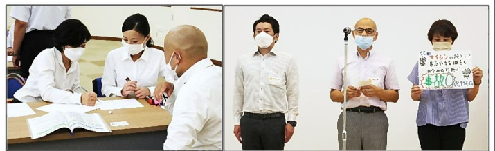
グループ話し合い・グループ目標発表の様子

各グループでアドバイザーを含めて話し合い、第45期のグループ目標を決定して発表を行いました。定めた目標が達成できるように、グループで団結して頑張らしましょう。