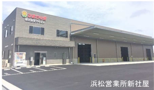
浜松営業所新社屋