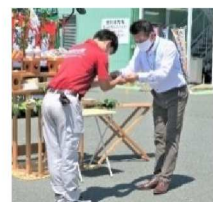
鍵を渡している様子

日頃から安全第一を心掛けて運行しております。運転・荷物の取扱いに引き続き気を配り、お客様に信頼して頂けるドライバーになります。 運行5G T・Y