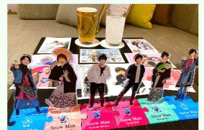
お気に入りグッズ写真

ジャニーズで初めて大学院を卒業していて、3回試験を受けて気象予報士の資格を取った努力家の子です。ファンからはあざとかわいいと言われています。私が大好きになった理由がそのあざとかわいいです。インテリジャニーズとして、朝の番組やクイズ番組などに多く出演しているので、見かけた時には「私の好きな子だな」と思ってください。