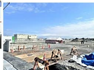
新営業所建設予定地