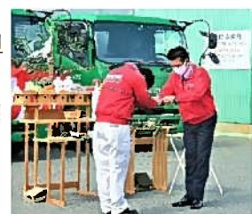
鍵を渡している様子