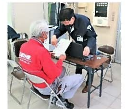
適性検査中の様子