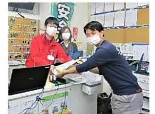
ハンドソープ配布の様子