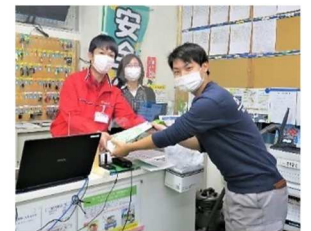
ハンドソープ配布の様子