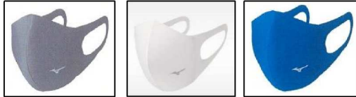
05 チャコール 01 ホワイト 27 ブルー 3色全て で工作中に使用できます。