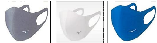
05 チャコール 01 ホワイト 27 ブルー 3色全てで工作中に使用できます。