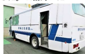
お越し頂いた巡回バス