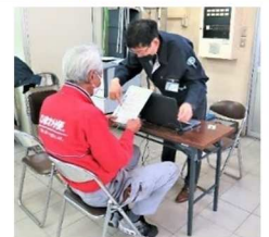
適性検査中の様子