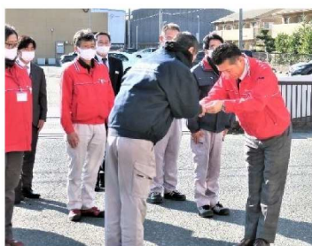
納車式・鍵を渡している様子