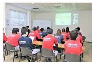
安全講習会の様子