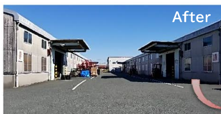
ラインが引かれた後