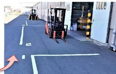
このようなラインが引かれました

これまではきちんと誘導しているつもりでも、停車位置が曖昧で建物から離れたり近すぎたりすることが多く苦勞していたので、ラインを引き終わった時は、「これでドライバーさんや倉庫担当者が停車位置で苦勞なくて済む」と安堵しました。