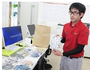
手作り布マスクを選んでいる様子