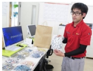
手作り布マスクを選んでいる様子