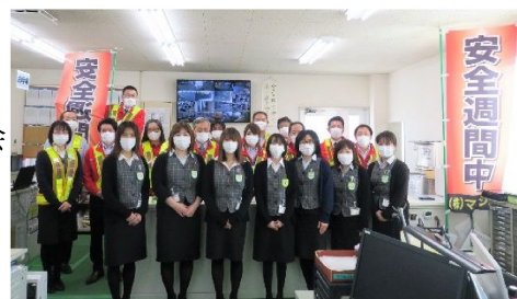
安全ベストとワッペンを着用し啓発活動

愛知県は、交通事故による死者数が全国でも昨年度17年ぶりにワースト1位からは脱却出