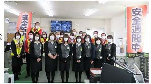
安全ベストとワッペンを着用し啓発活動

この期間を通じて、自身の運転の仕方を再度見直し今後の交通事故防止に努めていく事に繋がっていきます。