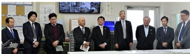
(写真左より) 活力朝礼見学の様子

2月14日(金)、日本ローカルネットワークシステム協同組合連合会関東地域本部より積み合せ部会・倉庫部会の方々総勢9名様が活力朝礼と施設見学にご来社されました。