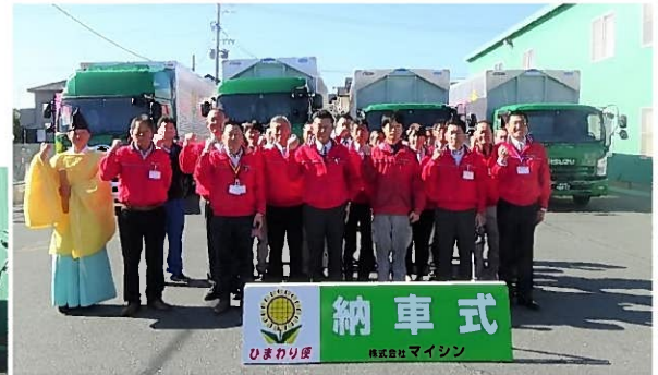
納車された4台のトラック前で記念撮影