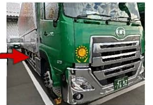
車体もピカピカです