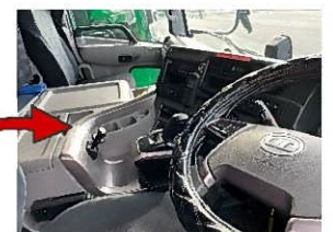
車内清掃ですっきり