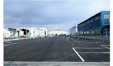
舗装後の第1駐車場

今後も駐車場に限らず、社員の皆様が気持ち良く日々の業務に取り組めるよう環境整備に取り組んでまいります。