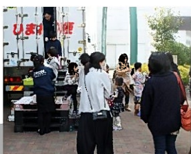
↑ イベント中の様子 ← シャボン玉体験