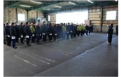
参加者全員での活力朝礼