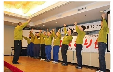
前回の発表の様子