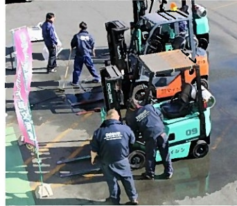
フォークリフト洗車の様子