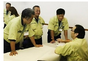
ディスカッションの様子