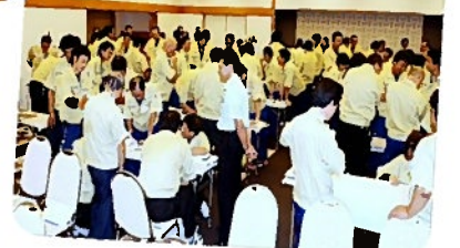
昨年の小集団活動の様子