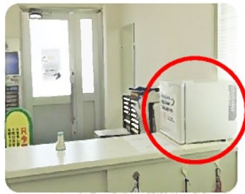
おしぼり設置場所

毎日厳しい暑さが続いています。そんな中、汗をかいて頑張ってきてくださるドライバーさんに少しでも一息ついてもらえたらと思い、今回の設置に至りました。