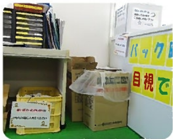
分別にご協力ください

ちなみに、おしぼりは持ち出し禁止となっております。また、使い終わったものやおしぼりの入っていたビニール袋の分別にご協力ください。ルールを守っていただけない場合はおしぼりを提供することができなくなりますので皆さんのご理解とご協力をお願い致します。