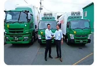
辻社長と菅嶋部長