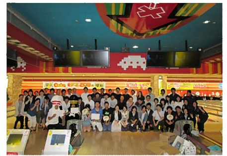
参加者全員で集合写真