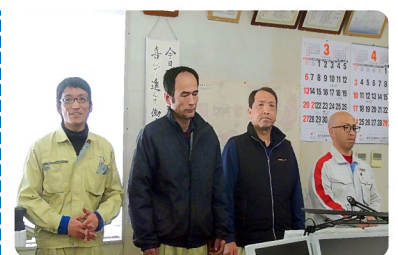
3月18日に参加された方々