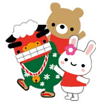
← 納めた千本旗 (一番手前)