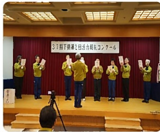
前回の発表の様子