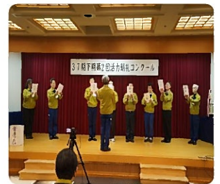
前回の発表の様子