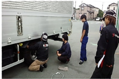
講習会の様子 皆さん真剣です