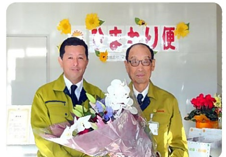
清水会長(右)と辻社長(左)