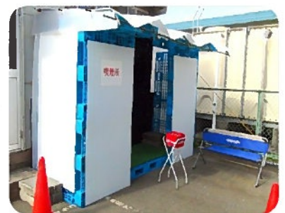
設置された喫煙所