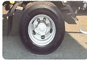
キレイにされたタイヤ