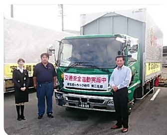
参加者での集合写真

また、パレードの最中に弊社のトラックを何台か見かけましたが、制限速度を守って安全運転を心掛けているのが伝わってきました。なかなかドライバーさんが外でトラックを走らせているところを見る機会がないので、新鮮な気持ちになりました。今回このよう