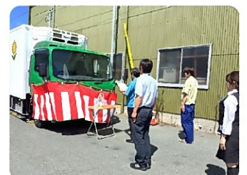
浜松東での納車式の様子