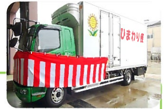
納車された冷凍車

A3: 今まで車を接触させたことは一度もないので、新しくなって多少は意識しますが、今までと変わらず安全運転をしていきたいと思います。