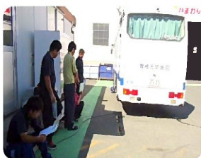
胸部レントゲン待ち