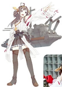
←「艦隊コレクション」(ゲーム) 金剛ちゃん