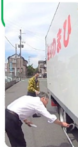
塩とお酒で 清めます