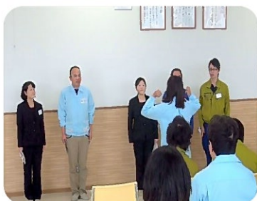
グループ発表の様子