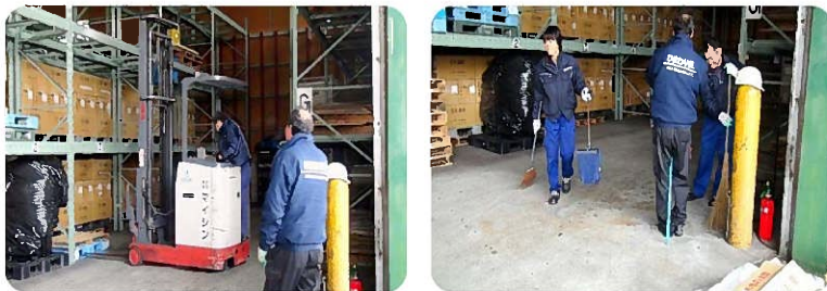
役割分担もきっちり。普段、見えない部分も掃き掃除。