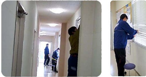
窓の溝やブラインド、丁寧な掃除に感謝