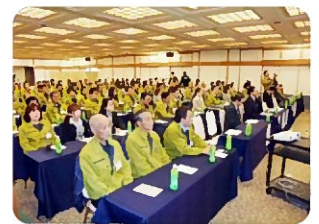
経営方針発表風景