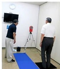
瞬発力テスト (ジャンプ)