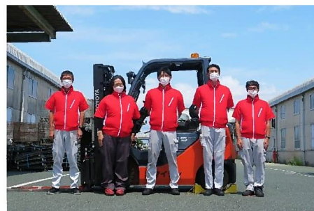
ファン付き作業服を着用した 本社倉庫部の皆さん

猛烈な暑さが連日続いています。熱中症にならないよう、水分補給など意識して作業を行いましょう。