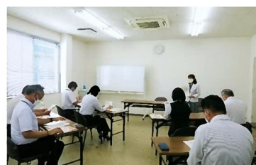
健康づくり講座の様子

協会けんぽ様では、事業所の健康づくり支援の為に年度に一度集団講座を行っており、この度弊社にて無料で提供していただけることになりこの度行われました。