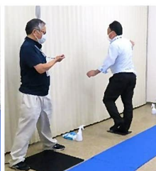
両目閉じ 片足立ちテスト