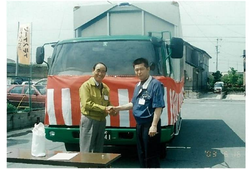
納車式の様子(清水名誉会長と辻社長)