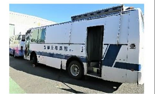
お越し頂いた健診バス

また、健診の結果、再検査となった方を対象に随時面談を実施します。管理部より声を掛けさせて頂いた時は、ご協力頂きますようよろしくお願い致します。面談する時間等のご要望は、管理部または総務部にお申し出頂ければ、随時対応致します。お気軽にお声掛け下さい。なお、再検査となっている項目に関して、現在治療を行っている場合であってもその診断結果が必要となる場合がありますので、お手元で保管をお願いします。皆様にはお手数をお掛け致しますが、ご理解とご協力をお願い致します。