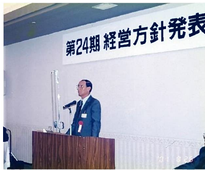
第24期経営方針発表会の様子